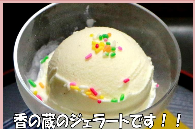
香の蔵のジェラートです！！